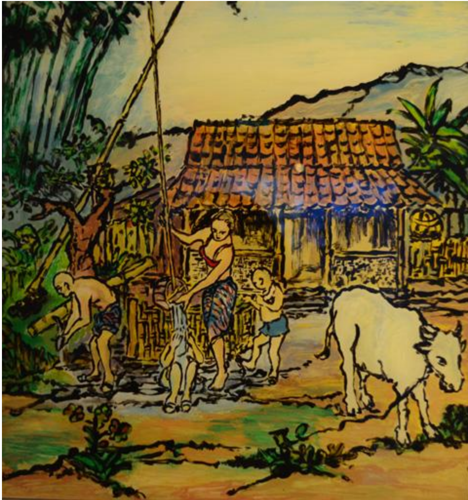
Phụ nữ Madura giặt bên giếng