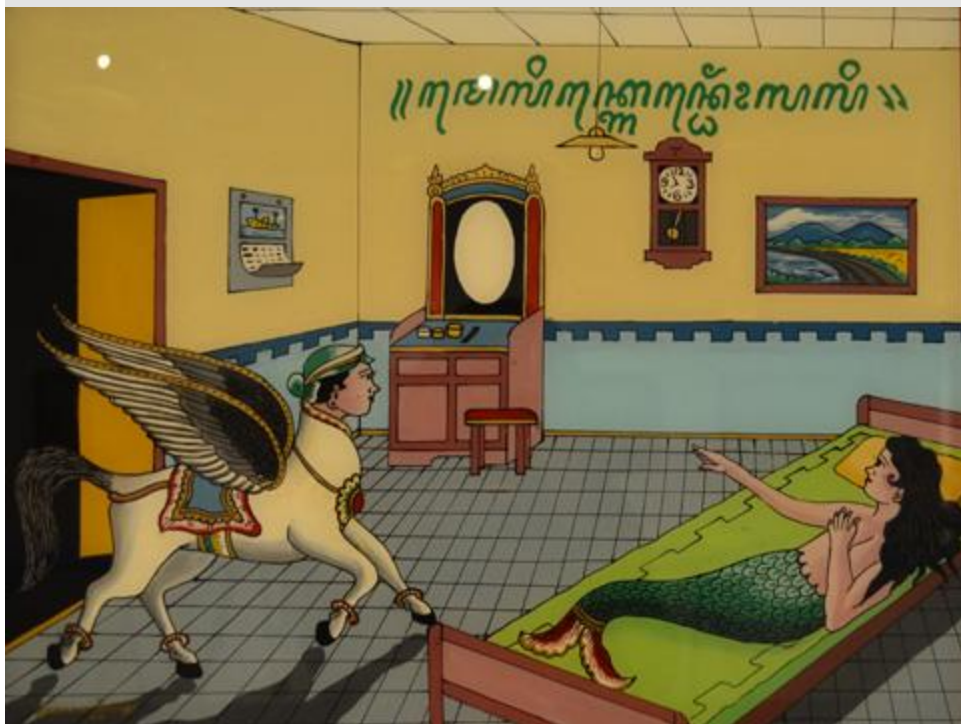
Đừng quên: Bức tranh hàm ý phê phán xã hội, nhắc nhở rằng giàu sang, niềm vui thích và cảm xúc không tồn tại ở thế giới bên kia