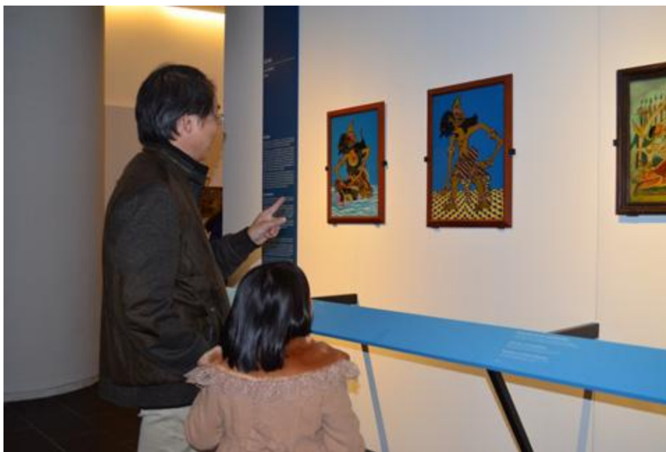
Nhiều người rất thích thú khi được tận mắt xem những bức tranh kính cổ xưa của Indonesia.

Nghệ thuật tranh kính bắt nguồn từ châu Âu, du nhập vào Indonesia đầu thế kỷ 20 cùng với người Hà Lan và phát triển cực thịnh tại đây trong những năm 1930. Để tạo nên một tác phẩm trên kính, người ta vẽ ngược với quy trình thông thường; nét vẽ đầu tiên chính là nét cuối cùng của tranh trên giấy hay vải.