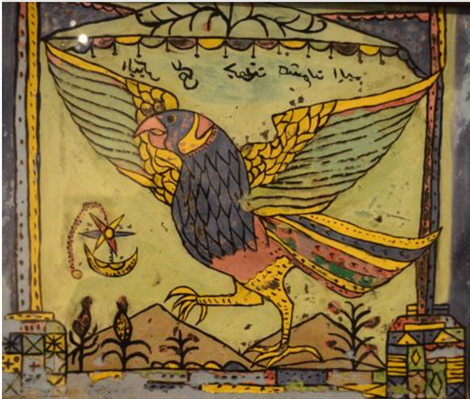
Chim và thư họa