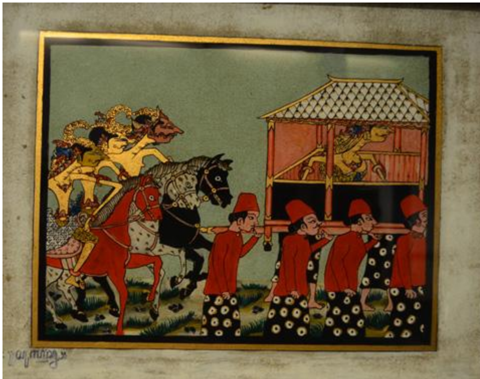
Một cảnh trong Yamayana (Nàng Sita được cứu và Ravana thất trận).

Bà Rosalia Sciortino cho biết: "Tranh kính Indonesia lấy cảm hứng từ nhiều chủ đề trong cuộc sống hằng ngày, nghệ thuật dân gian, nghi lễ và lễ hội, Hồi giáo và lịch sử Indonesia, 2 sử thi Mahabharata, Ramayana và huyền thoại, với hình thức nhân vật gần với sân khấu rối và những ảnh hưởng. Có rất nhiều phong cách vẽ tranh kính khác nhau, tùy thuộc vào các vùng địa lý của Indonesia.