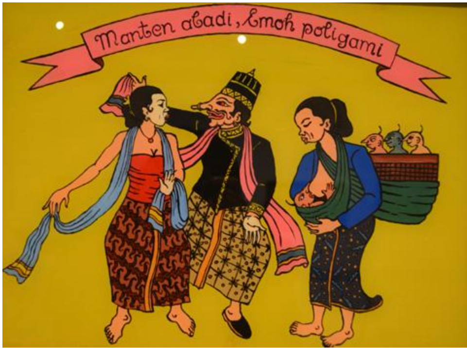
Đôi lứa bất diệt, vứt bỏ đa thê