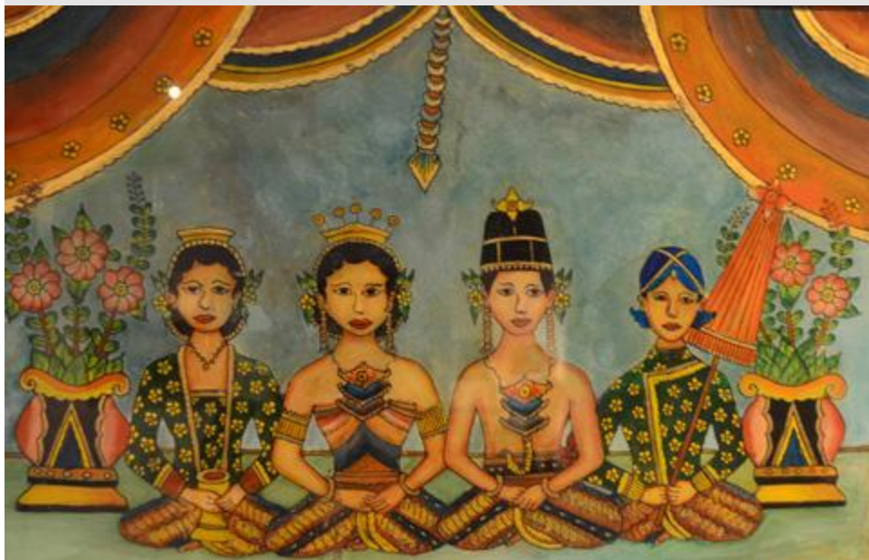
Đám cưới ở Yogyakarta