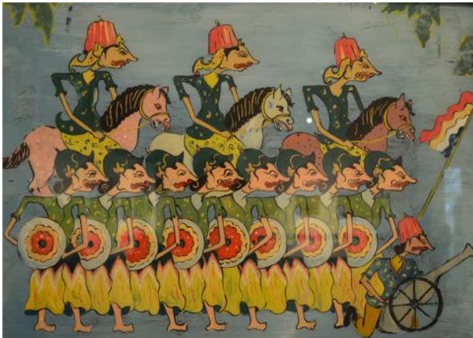
Binh lính của vương triều Solo

Bảo tàng vào quá trình xây dựng Cộng đồng Văn hóa - Xã hội ASEAN vào năm 2015. Việc tổ chức trưng bày tranh kính Indonesia tại Bảo tàng cũng thể hiện sự tôn vinh đối với những người hiến tặng các bộ sưu tập hiện vật".