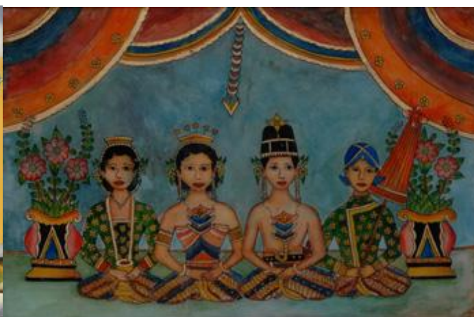
Đám cưới ở Yogyakarta